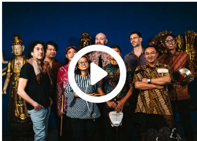
Teaser Gaga Gundul