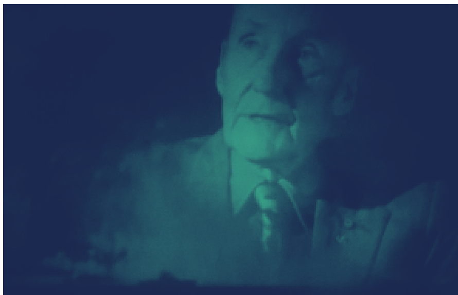
William Burroughs « A Thanksgiving Prayer »

Aux croisements du jazz moderne et du rock progressif, « BEAT » s'inspire et met en musique les textes des trois poètes majeurs de la « Beat Generation », portés par la voix sensible et touchante de Caroline Sentis et sur les compositions du bassiste Alfred Vilayleck.