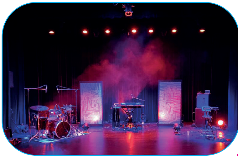
• Scénographie provisoire en 2D

Le groupe est autonome avec la scénographie et cette dernière est modulé en fonction du lieu d'accueil.