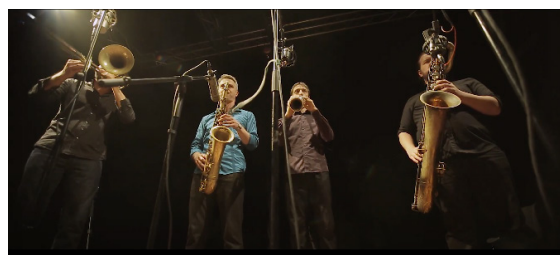
«Castelvania» LA DANSE DES INSOUMIS