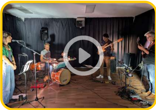
1er Teaser FRIDA - Résidence de Création Maison pour tous St Exupéry, Montpellier [34]

L'idée artistique de FRIDA est de concevoir un projet immersif pour le jeune public, mêlant musique et narration, illustrations animées, mise en scène et travail sur les lumières. L'objectif est, une fois encore, de porter à la connaissance du jeune public une figure féminine puissante et inspirante. Les quatre musiciens du collectif composeront une bande originale en s'inspirant de l'œuvre picturale et de la vie tumultueuse de l'artiste mexicaine. Le répertoire, allant de la chanson à l'improvisation, explorera un large éventail d'esthétiques musicales pour refléter la richesse et la complexité de l'univers de Frida Kahlo.